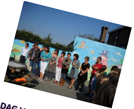
DAG VAN DE LEERKRACHT